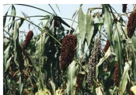
mil blanc et mil rouge